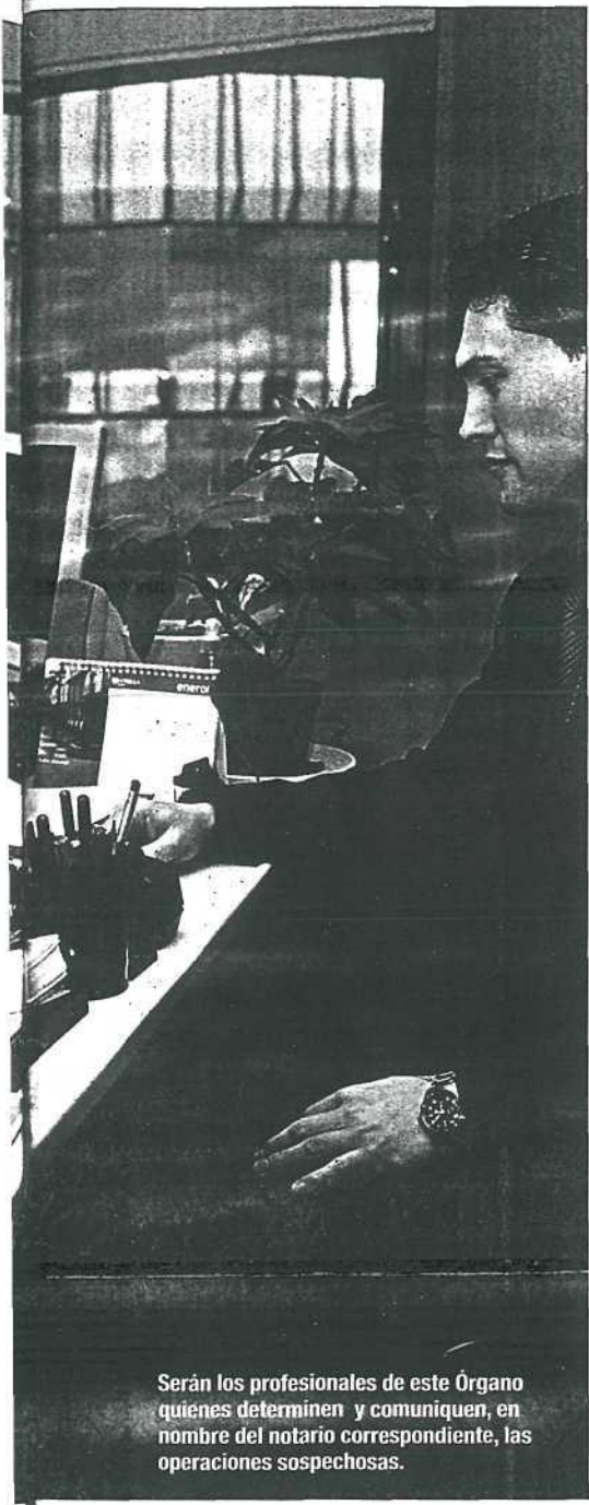
Serán los profesionales de este Órgano quienes determinen y comuniquen, en nombre del notario correspondiente, las operaciones sospechosas.

enero de 2004. En él se almacena toda información contenida en las escrituras y actas públicas, que los notarios envían periódicamente a los responsables del mismo.